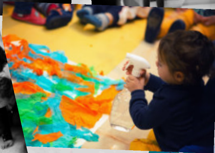
Photos des ateliers pédagogiques Trébeurden, septembre 2021